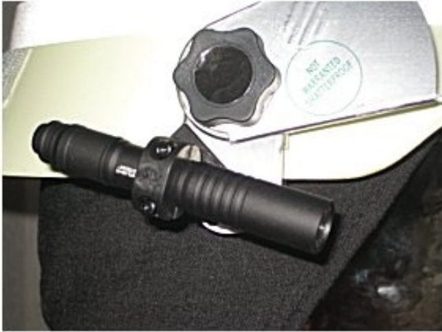
Klammer Bullard H3000 mit Visiermontage